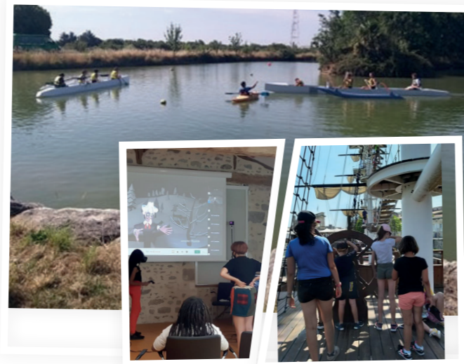
Ces temps d'activités se sont organisés en atelier par petits groupes soit en extérieur ou en intérieur.